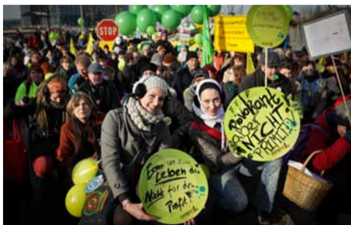
Erfolgreicher Auftakt der Kampagne »Meine Landwirtschaft« – die erste »Wir haben es satt!«-Demo vor einem Jahr.

Trotz des offiziellen Verbotes von Antibiotika in der Tiermast, werden 96% aller Hähnchen (in NRW) damit behandelt, werden Resistenzen gegen lebensrettende Medikamente gezüchtet. Europas Tierin-